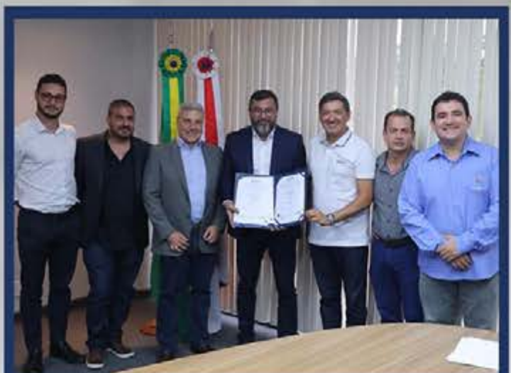
GOVERNADOR WILSON LIMA ASSINOU TERMO DE COOPERAÇÃO TÉCNICA COM ENEVA PARA INSTALAÇÃO DE UNIDADE DO CETAM EM SILVES. O CETAM OFERECERÁ CURSOS PARA ATENDER A DEMANDA DA EMPRESA GERANDO OPORTUNIDADE DE EMPREGO E RENDA