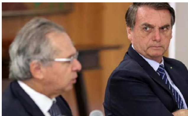
Por: Flávia da Hora