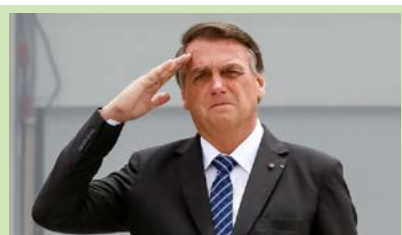
Por: Lara Tavares