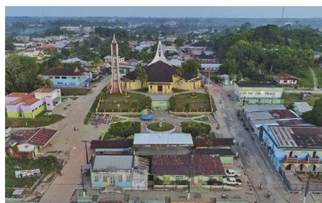
Por: Adriano Fernandes

Com as possíveis irregularidades expostas, a conselheira decidiu por suspender o pregão eletrônico e deu o prazo de 15 dias para que a UEA e o Centro de Serviços Compartilhados se pronunciem acerca dos fatos narrados e comprovem a regularidade das decisões realizadas durante o certame.