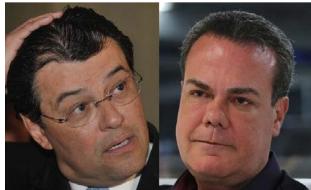
Por: Adriano Fernandes