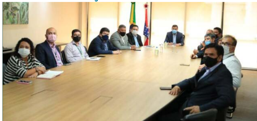
Por: Shayenne Medeiros