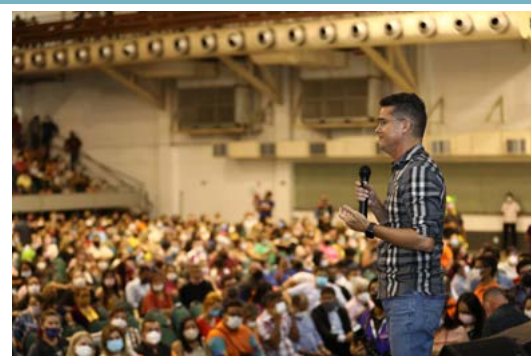
Por: Shayenne Medeiros