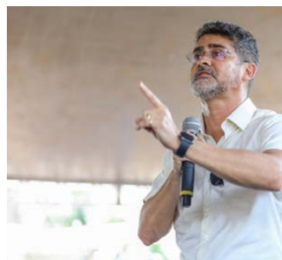
Por: Adriano Fernandes