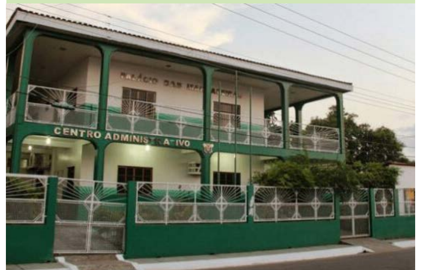
Por: Flávia da Hora